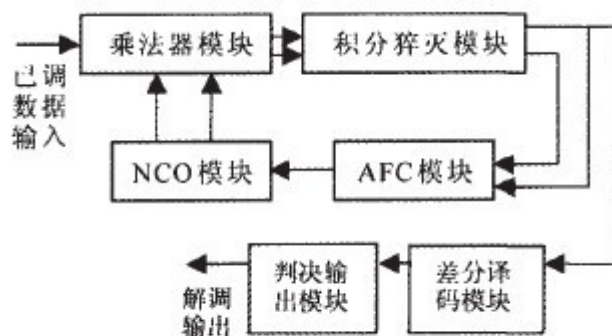
图2 接收子系统模块图

乘法器模块是一个 8 位乘法器，采用的是 ALTERA 的宏功能库中的乘法器，它把经模数变换后输出的 8 位数据分别与 NCO 输出的正交载波相乘。乘积结果为一有符号的 16 位数据。用 Verilog HDL 编程时，则可以以例化的方式调用乘法宏模块。经过乘法器模块出来的数据进入到积分猝灭滤波器，它的作用是进行低通滤波，滤去乘法器模块输出信号中的高频部分。在这里积分猝灭的控制信号即为数据信息码元的位同步信号，它是在伪码同步后产生的，即每经过一个伪码周期产生一个积分猝灭信号，也就是对输入的信号进行累加，每经过一个伪码周期产生一个输出信号: \text{Dot}(k) = R \sum (\Delta \tau) , 输出信号 \text{Dot}(k) 和 \text{Cross}(k) 作为进行差分译码和鉴相的输入信号。NCO 是基于一个给定频率的信号发生器，其信号的数字化波形可以在一个更高时钟频率下进行相位累加而得到。在这里，需要满足奈奎斯特抽样定理，即待产生的频率低于时钟频率的 1/2。数控振荡器一般由相位寄存器、相位累加器、正弦查找表等部分组成，如图 3。